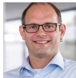
Andreas Koch Service & Consulting