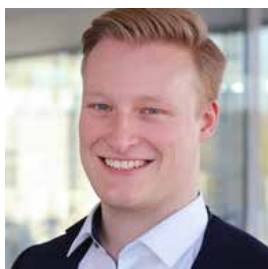
Kevin Kramer Service & Consulting