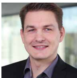
David Schlenke Service & Consulting