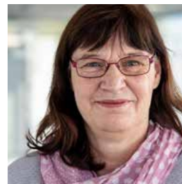
Anke Hofmann Service & Consulting